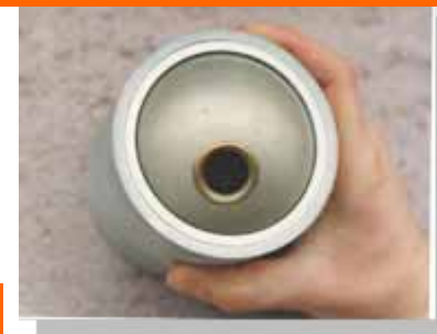
Видеокамера для МЕТРОПОЛИТЕНА

С момента основания Компания «БайтЭрг» работала над спецзаказами различных государственных и коммерческих организаций.