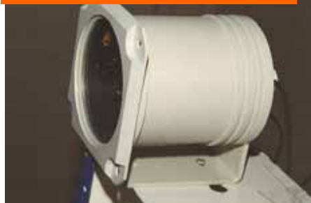
Первая поворотная камера