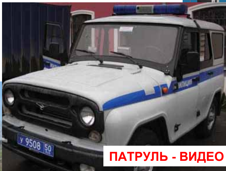
ПАТРУЛЬ - ВИДЕО