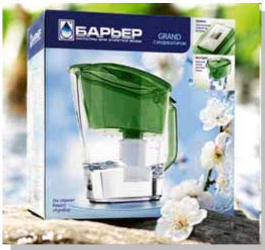
Фильтры для очистки воды БАРЬЕР ЗАО «МЕТТЭМ-Технологии»