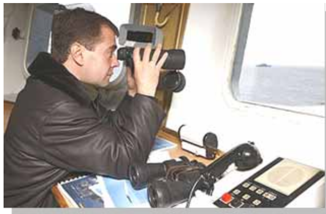
Бинокли FARVISION Компания ФАРВИЖН