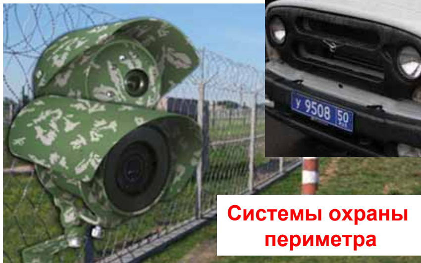
Системы охраны периметра