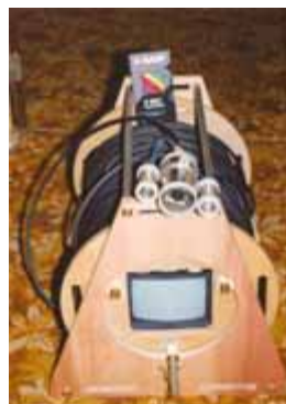
видеокамера для исследования стыков труб