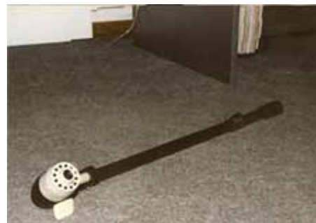
Видеокамера для досмотра автомобилей