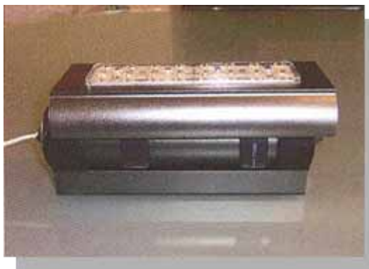
Уличная светодиодная лампа СЛМ 42-хх «МЕТТЭМ-СВЕТОТЕХНИКА»